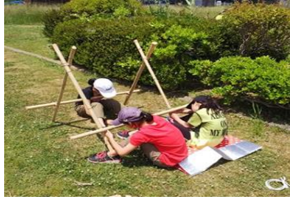
▲キャンプクラフト