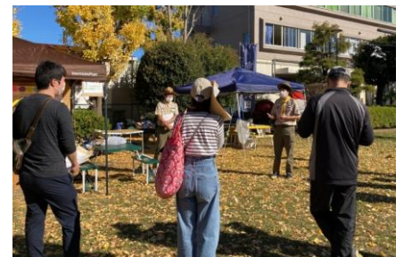
▲ボーイスカウト活動の説明をするローバースカウト(右)