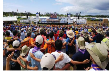
▲日本ジャンボリー