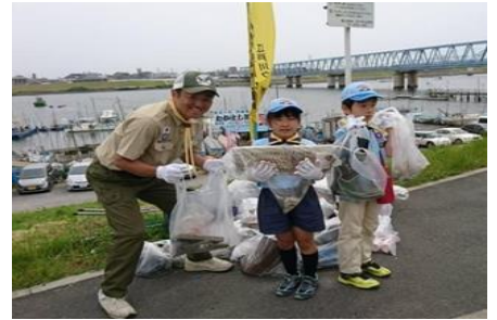
▲クリーン作戦(ゴミゼロ) 江戸川河川敷のゴミ拾い