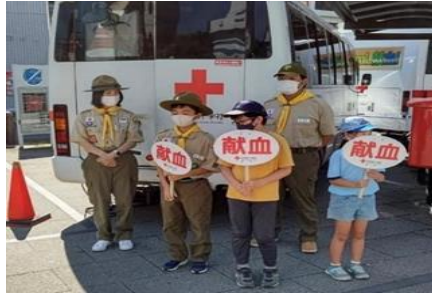
▲献血呼びかけ奉仕 主催:行徳ライオンズクラブ