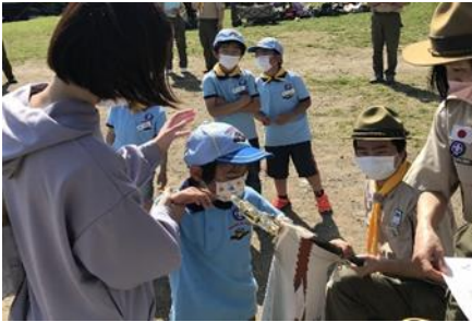
▲上進式 ボーイスカウトの入学式

団主催で（ビーバー隊からローバー隊）が集まって活動します。回数は年に6～7回程度です。