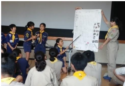
▲夏キャンプ報告会