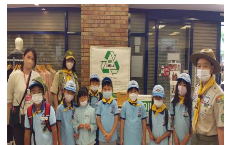
▲ユニクロ衣料難民支援プロジェクト