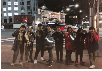
▲オーバーナイトハイク

ボーイ隊は小学6年生から中学3年生までが所属する隊で、子供たちが中心となり、野外活動を基本として、様々なプログラムを計画し実行することで、責任を持って社会に貢献できる青少年を育成するための教育活動です。