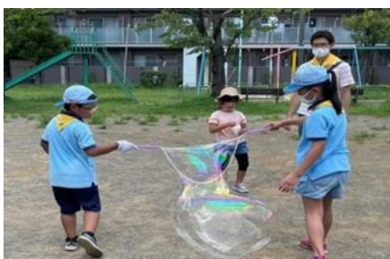
▲しゃぼん玉あそび