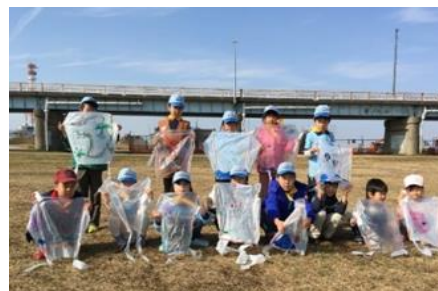
▲お正月の遊び 凧あげ